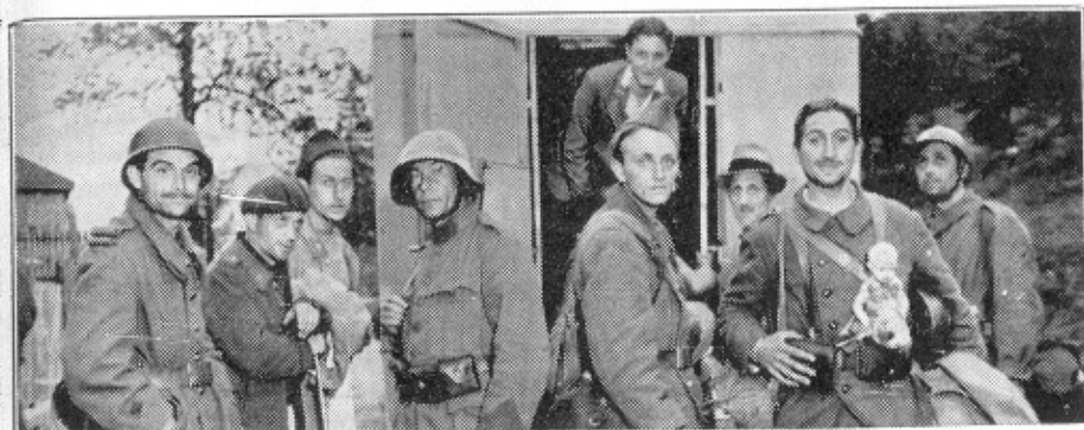
Les premiers soldats français arrivent à la frontière suisse

Le dimanche 16 juin, vers 6 h. du matin, les premiers réfugiés civils français entrent à Boncourt. Ce sont des habitants de Delle et des villages voisins. Le défilé continue toute la journée et toute la nuit. Les premiers douaniers français arrivent dans la soirée. Beaucoup d'automobiles : on organise des parcs.