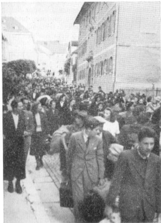
Réfugiés civils à Porrentruy, Rue de la Préfecture

Dans la soirée du même jour, 3 à 400 soldats polonais qui n'ont pas pu trouver de place à Porrentruy, arrivent à Fontenais