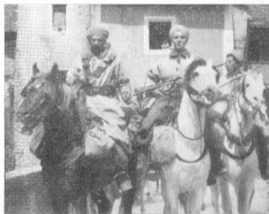
A St-Ursanne, un groupe de spahis

Les troupes automobiles furent acheminées sur Delémont par Develier. Les troupes hippomobiles et à pied le furent sur Boécourt. Ces évacuations se firent en bon ordre. Cependant, que de difficultés dans la montée