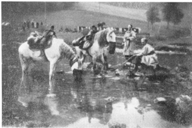
Soubey et son Doubs transformés en oued

Le capitaine, nerveux, fait faire le bivouac, demande à pouvoir acheter un peu d'avoine, à n'importe quel prix. Depuis 48 heures ils n'en ont plus. Encore une vision dans le film de ces jours : ces hommes basanés, accroupis à la musulmane sur les pierres du Doubs, faisant boire leurs montures piaffantes, des gestes lents, une langue gutturale; Soubey et son Doubs transformés en oued, en oasis du Sahara!