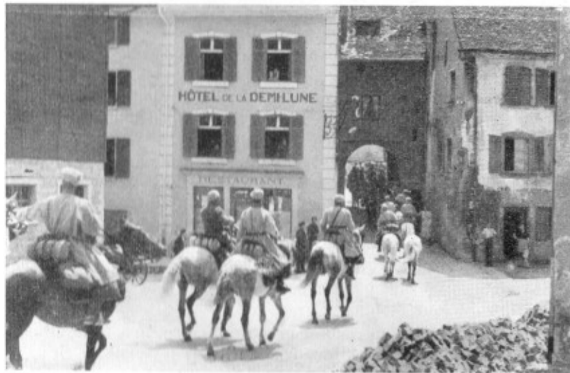
St-Ursanne, passage des spahis

Un seul incident : Un soldat polonais dont l'attitude est menaçante essuya le feu de nos sentinelles à la frontière de La Motte. Grièvement atteint, il décéda des suites de ses blessures.