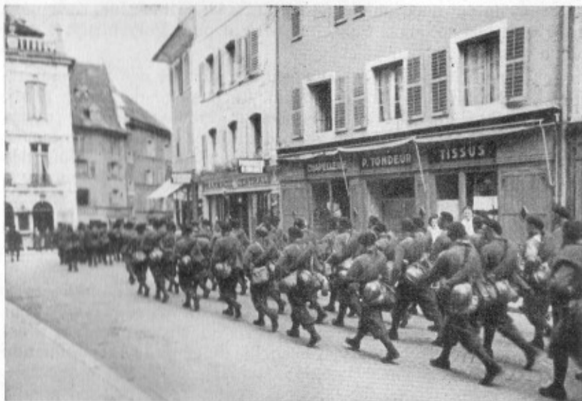
Soldats polonais à Porrentruy, Rue Centrale

Des camions ne vont pas tarder à emporter les réfugiés. Le temps presse : il s'agit de les envoyer au plus tôt à l'intérieur ; des soldats français, polonais, belges, sont signalés à la frontière. Ils déposeront les armes et seront internés en Suisse. Durant trois jours et trois nuits, ce n'est que le défilé bruyant de centaines de véhicules motorisés soit suisses, soit étrangers, sur toutes les routes du pays.